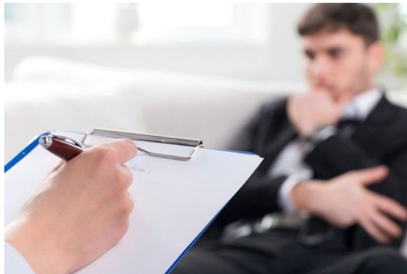
• Holenderski parlament przyjął ustawę, która zakłada, że obcokrajowiec będzie musiał zaświadczenie o poczytalności.

Holenderski parlament przegłosował kontrowersyjną ustawę wprowadzającą obowiązek badań psychiatrycznych dla obcokrajowców szukających pracy w kraju tulipanów