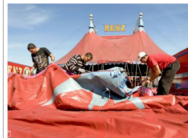
• Licytacja namiotów należących do słynnego zespołu cyrkowego cieszyła się dużym zainteresowaniem.

Kto w Holandii nie znał objazdowego cyrku Herman Renz? Dwóch przedsiębiorców ze Zwanenburga (koło Amsterdamu) zakupiło w drodze licytacji namioty należące wcześniej do bardzo popularnego swego czasu w Holandii, Cyrku Herman Renz.