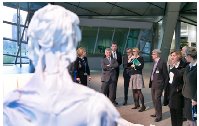
• Podczas otwarcia wystawy w siedzibie Europejskiego Banku Centralnego we Frankfurcie nad Menem

Wystawę w ramach cyklu „Sztuka współczesna państw członkowskich UE” można oglądać w budynku EBC we Frankfurcie nad Menem do 19 czerwca br.