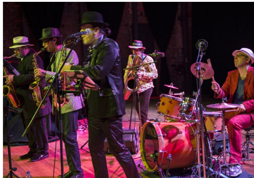
• Koncertuje również z zespołem Carla ma po całej Holandii.