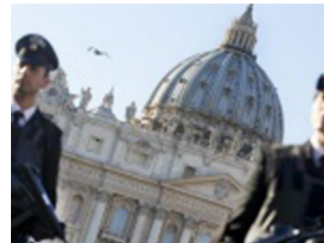
• Zamachy terrorystyczne we Francji oraz Belgii sprawiły, że podwyższone środki bezpieczeństwa wprowadzono we Włoszech.

prosi o zachowanie zwiększonej ostrożności oraz o bezwzględne stosowanie