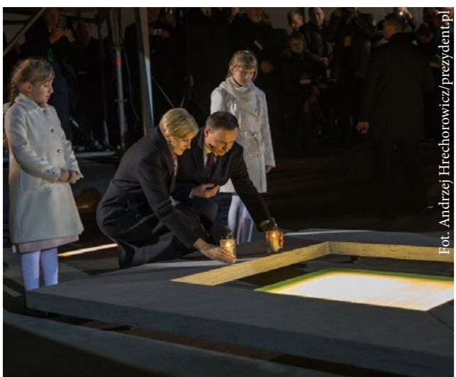
• Prezydent na otwarciu Muzeum Polaków Ratujących Żydów podczas II wojny światowej im. Rodziny Ulmów w Markowej